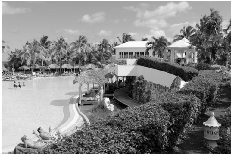
На верхнем снимке: отель Мелья Кайо Коко, расположенный на островке Коко у северного побережья Кубы. На нижнем: г. Гавана, площадь Святого Франциска. Выставка «Искусство - за толерантность». Медведи символизируют государства мира.

С.В.Семячко, первый секретарь горкома КПРФ, помощник депутатов Московской областной и Государственной Думы.